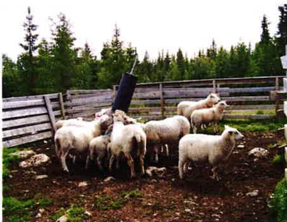
Sau på salte- og sankeplass i Bødal.

Det utbetales regionalt miljøtilskudd til drift av beitelagene på grunnlag av antall sau og storfe sanket fra utmarksbeite. Tilskuddet i 2015 er kr 12 pr. sau og kr 22 pr. storfe sanket.