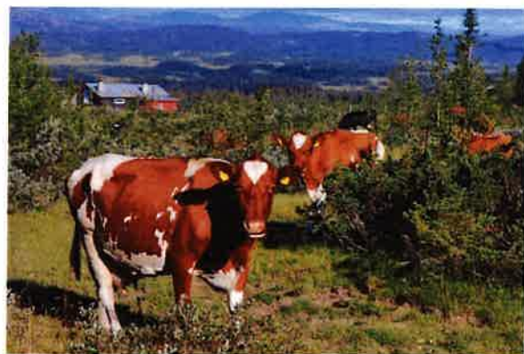
Ku i Gausdal Vestfjell.

I 2015 var det 14 setre med mjølkeproduksjon i drift i kommunen. Av disse var det 13 enkeltsetre og en felleseter med flere deltakere. De fleste setrene ligger i Gausdal vestfjell. Diagrammet under viser utviklinga i antall setre i drift i perioden 2005-2014 i Gausdal. På mange av disse setrene er mjølkekyrne på utmarksbeite om dagen og på innmarksbeite om natta. Disse dyra inngår i totalantallet storfe på utmarksbeite i tallene hentet fra produksjonstilskuddssøknadene.